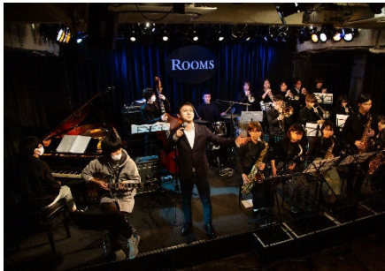
YOUNG JAZZ FUKUOKA BIG BAND

戦後、福岡の音楽文化は将校クラブや中洲のグランドキャバレーから花開いた。そんなジャズシーンの中心にいたのが「太田幸雄とハミングバード」であった。90年代、渋谷系やクラブジャズシーンで再評価されたが、今新たに福岡の若いDJやジャズプレイヤー達が彼らを蘇らせる。